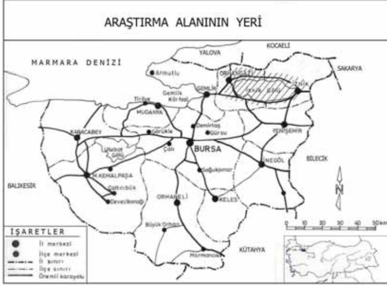
Şekil 1: Araştırma alanının coğrafi konumu.

İznik depresyonu, Marmara Bölgesi gibi işlek yolların en yoğun olduğu bir bölgede yer almakta, depresyonun batısından yük ve yolcu trafiğinin yoğun olduğu İstanbul-Bursa karayolu geçmektedir. Bu yol Yalova'dan sonra Samanlı dağlarının geçit verdiği bir boyun noktasını geçtikten sonra kuzey-güney ekseninde güneye inip Orhangazi'ye uğrar ve hemen ardından Orhangazi'nin güneyinde batıya doğru dönerek Garsak boğazından depresyonu terkeder. Bununla birlikte depresyonun doğu bölümü ve İznik şehri fazla işlek olmayan sapa bir yol üzerindedir. (Darkot ve Tuncel,1981) Roma İmparatorluğundan Osmanlı İmparatorluğuna kadar olan tarihi dönemde dini, ticari ve idari yönden son derece önemli bir yer konumunda olan depresyonun ve gölün doğu ucundaki İznik kenti, zamanla önemini kaybetmiş ve antik çağların kervan-ticaret yolları kullanılmaz olmuştur.