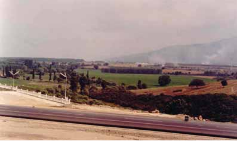
Resim 2: Orhangazi ovasının batı bölümünde zeytinlikler ve meyva-sebze bahçelerinin arasında endüstri tesisleri. Resimde görülen endüstri tesisi, Asilçelik çelik üretim tesisidir.

Geçmiş dönemlerde çok sayıda balıkçının geçimini sağladığı bir balıkçılık alanı durumundaki İznik gölü günümüzde bu önemini ve özelliğini kaybetmiştir. Yapılan mülakat ve incelemelerden varılan sonuçlara göre yaklaşık 20-25 yıl öncesine kadar ekonomik değeri olan balık türlerinin bulunduğu İznik gölünde önceleri sarı sazan ve yayın balığı türleri başta olmak üzere çok sayıda balık avlanmaktaydı ve yaklaşık 200 hane geçimini bu şekilde temin etmekteydi. Günümüzde de İznik, Çakırca, Boyalıca ve Gölyaka'da balıkçı kooperatifleri bulunmaktadır. Halen avlanan su ürünlerinin arasında bir tür mantar hastalığı nedeniyle 1980'lerden beri büyük bir azalma gösteren kerevit de bulunmaktadır.