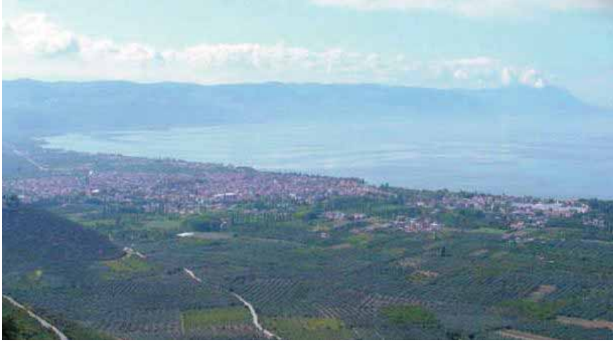
Resim1: Kuzeydoğudan Samanlı dağlarının eteklerinden İznik gölü ve İznik'in görünüşü.

Doğal bitki örtüsü bakımından Akdeniz flora alanı ile Paleoboreal Avrupa florasının temas alanında yer alan İznik depresyonunda, başta iklim ve yeryüzü şekilleri, eğim, bakı, toprak özellikleri ve beşeri faktörlerin etkisi ile 3 ana bitki gurubu ayırt edilmektedir. Bunlar orman, maki ve psödo makidir. Ormanlar günümüzde insanların ulaşamadığı alanlarda varlıkları koruyabilmiş olup, beşeri faaliyetler sonucunda orman alanları maki, fundalık ve çıplak alanlara dönüşmüştür. Ormanlarda hakim türü, alçaklarda meşe, yüksek bölümlerde ise kızıl çamlar oluşturur. İnsan tahribinin yoğunlaştığı alanlarda maki ve psödo maki ormanın yerini alır. Depresyonun kuzeyindeki, İznik Gölüne bakan yamaçlarda maki türleri hakimiyet kazanırken, Avdan, Gürle ve Sarımeşe Dağlarının kuzeye bakan yamaçlarında psödo maki türleri hakimiyet kazanır. Maki türleri arasında en fazla rastlananlar Kocayemiş, Funda, Akçakesme, Sandal, Defne, Delice ve Erguvandır.