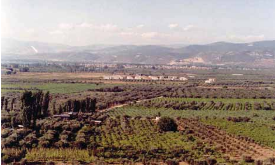
Resim3: Güneyden Dırazalı köyünden, İznik ovasının görünüşü. Plio-kuvaterner depolardan oluşan ova, zeytinlikler, bağlar, meyva ve sebze bahçeleriyle kaplıdır. Bu tarım alanlarının tamamında yapay gübre ve tarım ilacı kullanılmakta, kullanım sonrası atıkların tamamı verimli tarım topraklarını ve İznik gölünü kirlenmektedir.

değerlere yaklaşıldığını söylemek mümkündür. İznik gölü çevresinde Mn içeriklerinin izin verilen sınır değerleri arasında olmakla beraber, tarım topraklarının % 55'inde izin verilen sınır değerlerin üzerinde Ni konsantrasyonlarına rastlanmıştır. Sonuç olarak İznik havzasındaki topraklarımız, gerek İznik gölü ve akarsulardan alınan sulama sularıyla, gerekse tarımsal ilaçlar ve gübre kullanımıyla giderek kirlenmektedir.