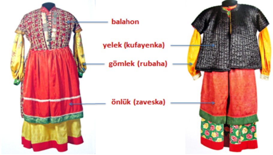
Resim 1: Nekrasov-Kazak Kadın Giysisi, 19. Yy. sonu-20. Yy. başları, Envanter No: КП 2295/2, 386/1, 17301/2, 9767, 9768, 9761/3, 9786, Kaynak: (НародыДона... Ростов-на-Дону, 2005, с. 72, 74)