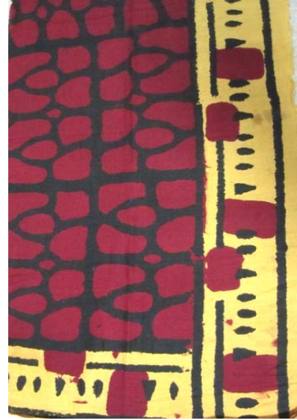
Resim 15: Tokat Yarım Elmalı Yazması-Alın Bezi, Staroçerkask Müzesi Koleksiyonu Envanter No: СИАМЗКП 4231