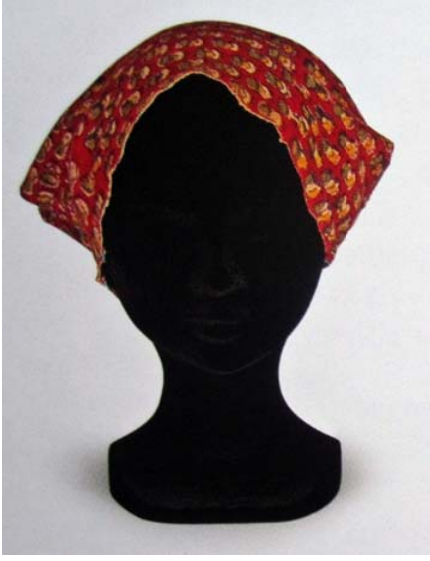
Resim 4: Bone (Şiçka), Envanter No: POMK КП 17299/1