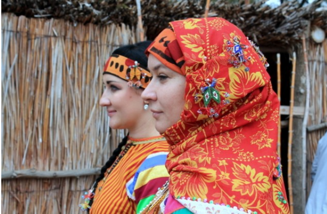
Resim 20: Günümüzde Rusya'da yaşayan Nekrasov Kazak kızlarının giydikleri geleneksel Alın Bezi ve Eşarbi gösteren bir fotoğraf