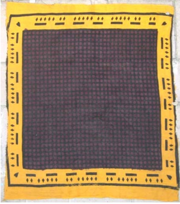
Resim 12: Kirazlı Tokat Yazması, Tokat Müzesi Envanter No: 5506