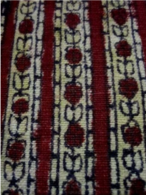
Resim 6: El baskısı Çiçek motifi Bone kumaşı, СИАМЗ КП 347