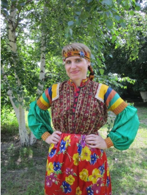
Resim 2: Nekrasov Kazak Kadın Giysi Takımı, Staroçerkask Müzesi Envanter No: СИАМЗ КП 1709/2