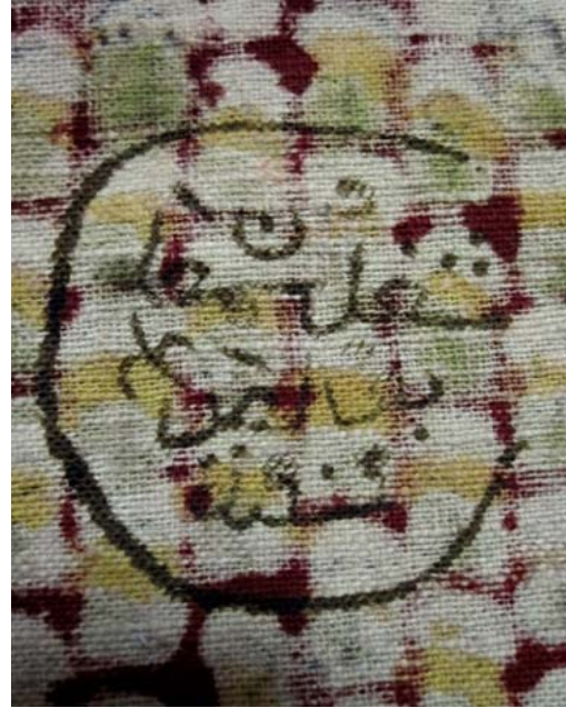
Resim 9: Osmanlıca bir üretici damgası (okunamamıştır) Staroçerkask Müzesi Koleksiyonu Envanter No: СИАМЗКП 3660/1