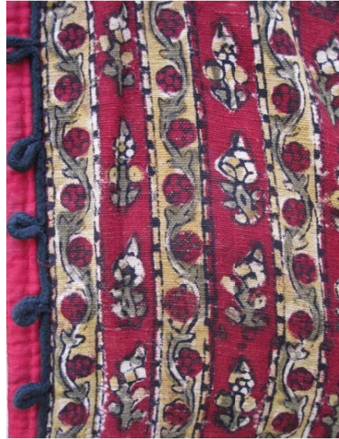
Resim 3: Balahon dikiminde kullanılan el baskısı kumaş. Staroçerkask Müzesi Envanter No: СИАМЗ КП 1709/2