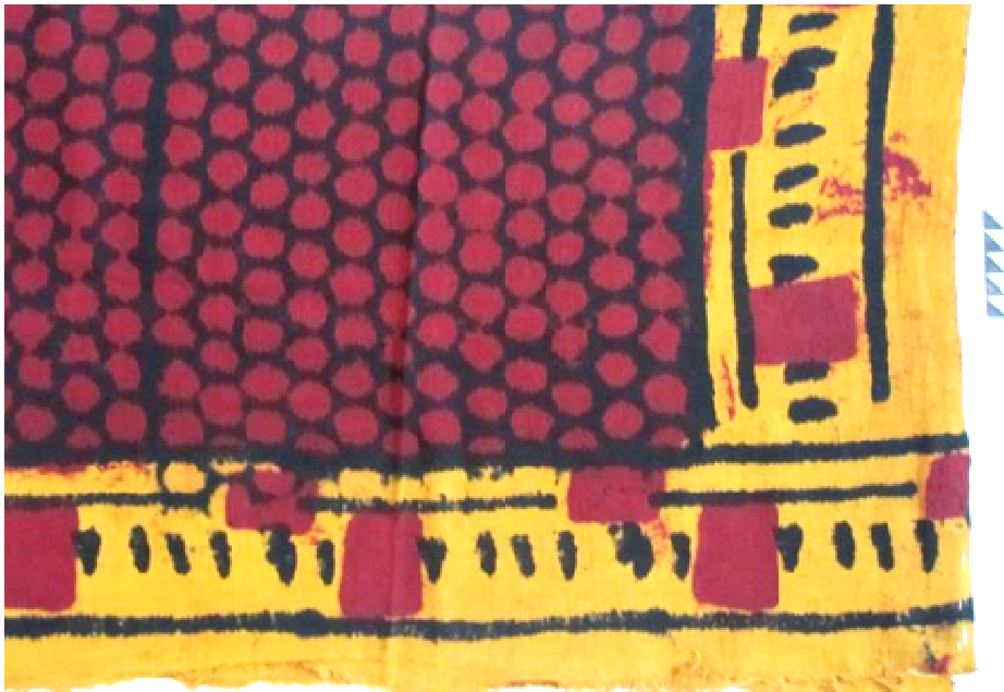
Resim 17: Kirazlı Tokat Yazması-Alın Bezi, Staroçerkask Müzesi Koleksiyonu Envanter No: CIAM3 3659/3