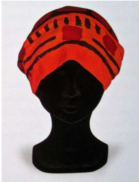
Resim 10: Alın Bezi. Envanter No: POMKKП 9329