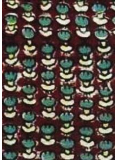
Resim 7: El baskısı Arı motifi Bone kumaşı, СИАМЗ КП 4228