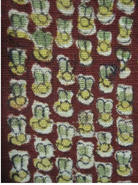
Resim 8: Arı desenli yazma Staroçerkask Müzesi Koleksiyonu Envanter No: СИАМЗКП 3660/1