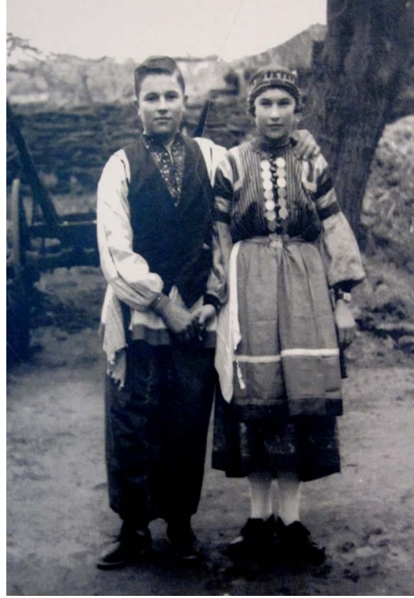
Resim 19: Geleceğin Ailesi isimli bir fotoğraf. Türkiye 1950, (Straçerkask Müzesi Koleksiyonu)