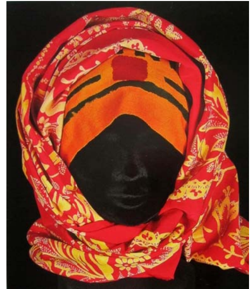
Resim 11: Alın Bezi üzerine sarılan Uruminskiy isimli Eşarp. Envanter No: POMKKП 9762