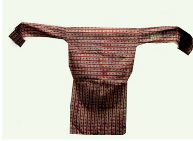
Resim 5: Bone (Şiçka), Staroçerkask Müzesi Envanter No: СИАМЗКП 347