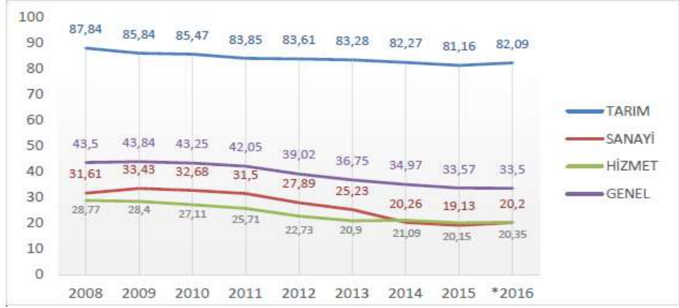
Grafik 2: Sektörlere Göre Kayıt Dışı İstihdam Oranı (%)