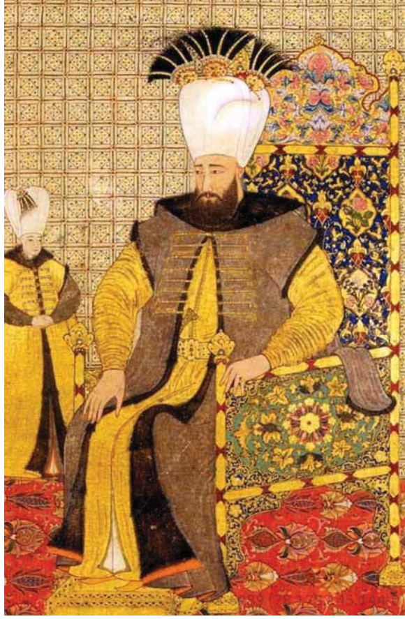
Resim 1. Levni, Sultan III. Ahmet , Kebir Musavver Silsilename, 1710-20, Minyatür, Topkapı Sarayı Müzesi.