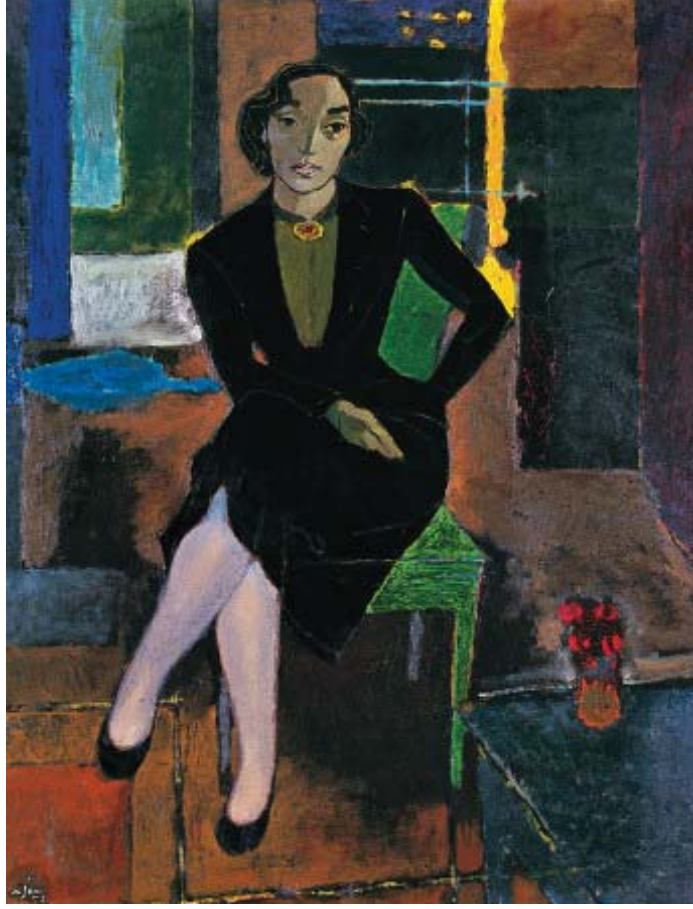
Resim 13. Nuri İyem, Adalet Cimcoz Portresi , 1952, Duralit Üzerine Yağlıboya, 75x65cm.

Kaynak: "Nuri İyem 100 Yaşında / Portre" Sergisi, İstanbul, Evin Sanat Galerisi, 2015.