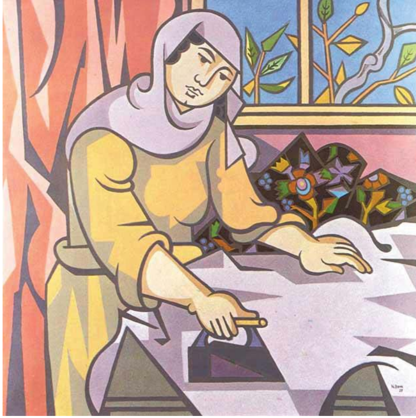
Resim 11. Nurullah Berk, Ütü Yapan Kadın , 1977, Tuval Üzerine Yağlıboya, 100 x 100 cm, Özel koleksiyon.

Kaynak: H., Kınaytürk, Nurullah Berk , Türk Ressamları:4, İstanbul, Garanti Bankası Yayınları, 1996, s. 114.