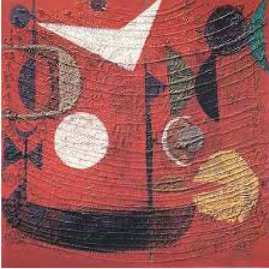
Resim 15. Bedri Rahmi Eyübođlu