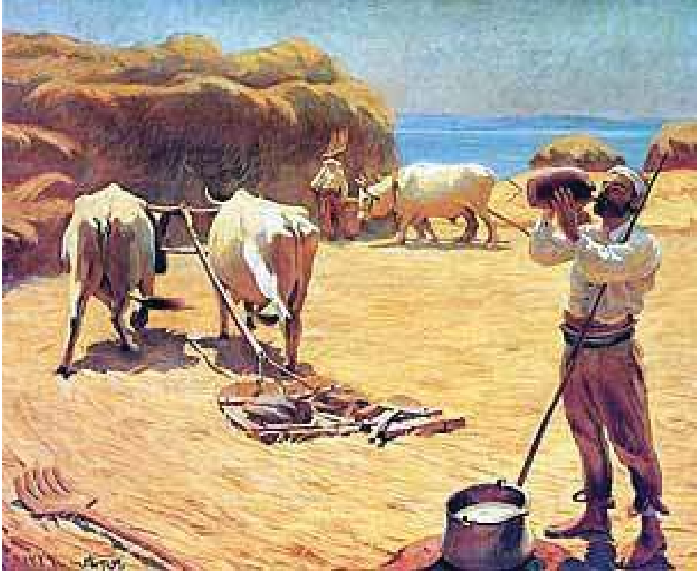
Resim 7. Namık İsmail, Harman , 1923 Tuval Üzerine Yağlıboya, 165x200cm, MSGSÜ İstanbul Resim Heykel Müzesi