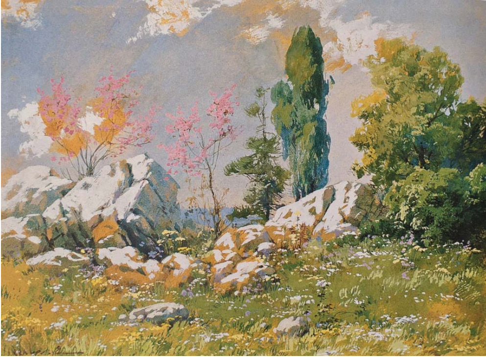
Resim 3. Hoca Ali Rıza, Peyzaj , 1922, Kağıt Üzerine Guaş, 20 x 27 cm, Özel Koleksiyon.

Kaynak: Ö. F. Şerifoğlu, Hoca Ali Rıza 1858-1930 , İstanbul, Yapı Kredi Yayınları, 2005, s.56.