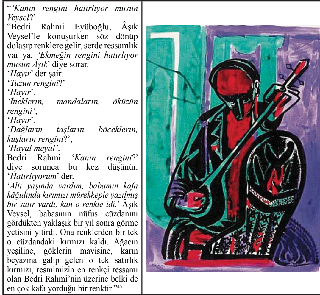
Resim 12. Bedri Rahmi Eyüboğlu, Aşık Veysel , 1954, Kağıt üzerine guaj, 37x27.

Kaynak: Kırmızı ve Sanat, P Dünya Sanatı Dergisi , Sayı: 50. Raffi Portakal Antikacılık Müzayede, İstanbul, 2008