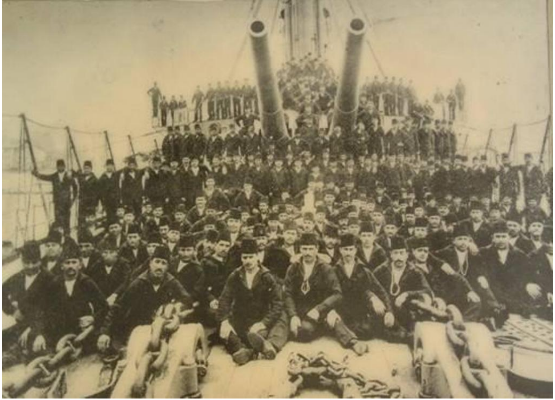
Barbaros Hayrettin Muharebe Gemisi ve Mürettebatı