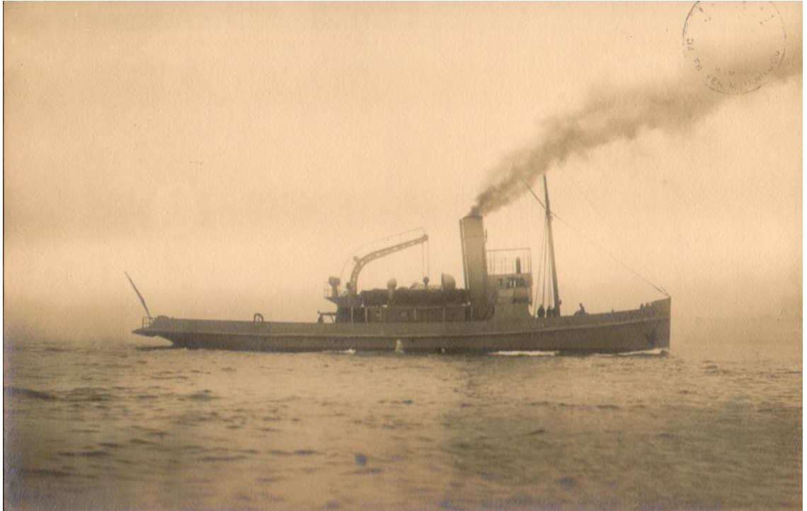
Nusrat Mayın Gemisi