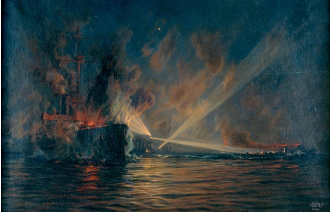
Muavenet-i Milliye'nin Goliath'ı Batırışı (Temsili)